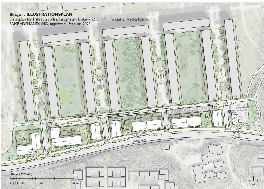
Bild 5. Illustrationsplan som visar den tänkta nya gång- och cykelbanan längst Fidravägen.