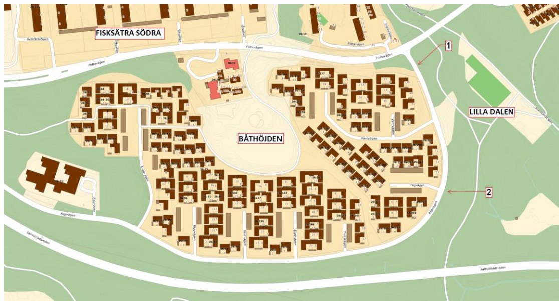
Bild 2. Bild över Båthöjden och Lilla dalen.