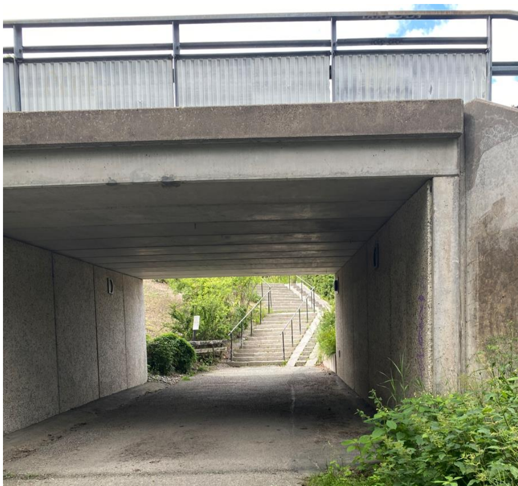
Bild 4. En av de två trapporna från Båthöjden till Gröna dalen (nr 2 på karta ovan).

Trafikenheten har sett över möjligheten att ersätta eller komplettera de befintliga trapporna med en tillgänglig anslutning men bedömer att det inte är möjligt utan ett större ingrepp med stor påverkan på omgivningen.