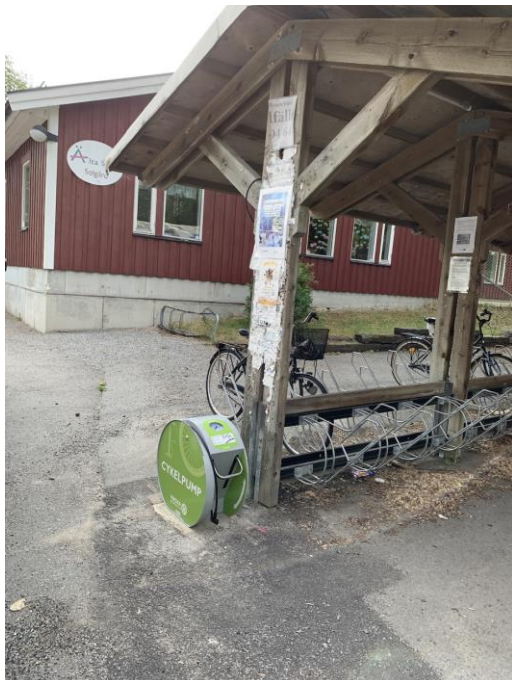
Bild 1. Ny cykelpump vid Ältakrysset