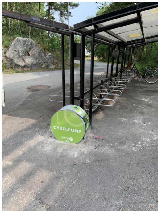
Bild 2. Ny cykelpump vid Tippen station