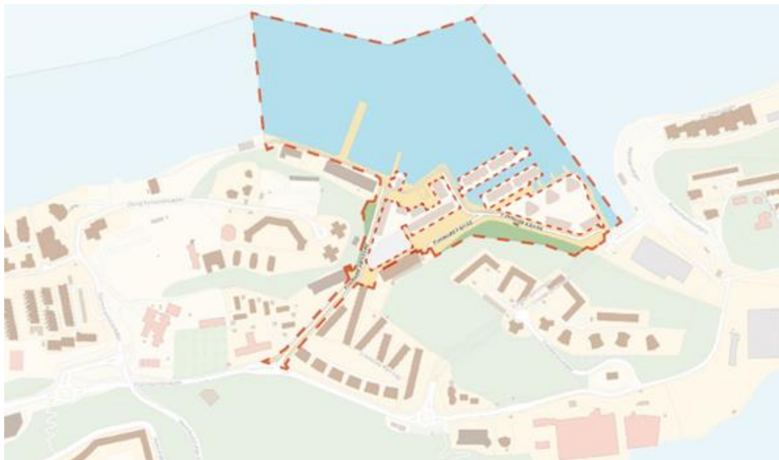
Bild 1: Översiktsskarta över Finnboda varv på västra Sicklaön, Nackas norra kust.

Planförslaget innebär bland annat att huvudgatorna i området, Finnboda varvsväg och Finnboda kajväg samt torgbildningar detaljplanläggas som allmän plats.