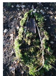
Eiffeltornet av skogsmaterial

Förskolan har gångavstånd till fler skogsområden som utnyttjas varje vecka. Pedagogerna berättar att förskolans femåringar besökt ett större skogsområde på förmiddagen. Barnen delas in i mindre grupper och får i uppgift att skapa ”bilder” med skogsmaterial som pinnar, kottar, blad etc. Barnen bygger och berättar därefter för varandra vad de byggt.