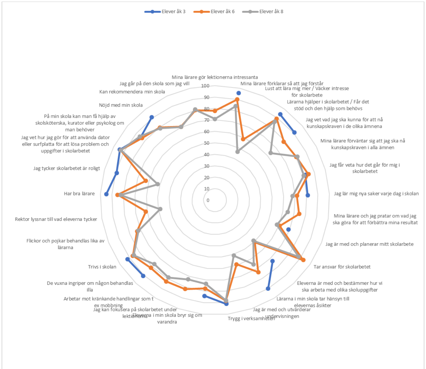
Figur 3: Andel elever som tycker att påståendet stämmer mycket eller ganska bra, grundskolan i Nacka, 2018 (eleverna i åk 3 får färre och i en del fall enklare formulerade frågor)