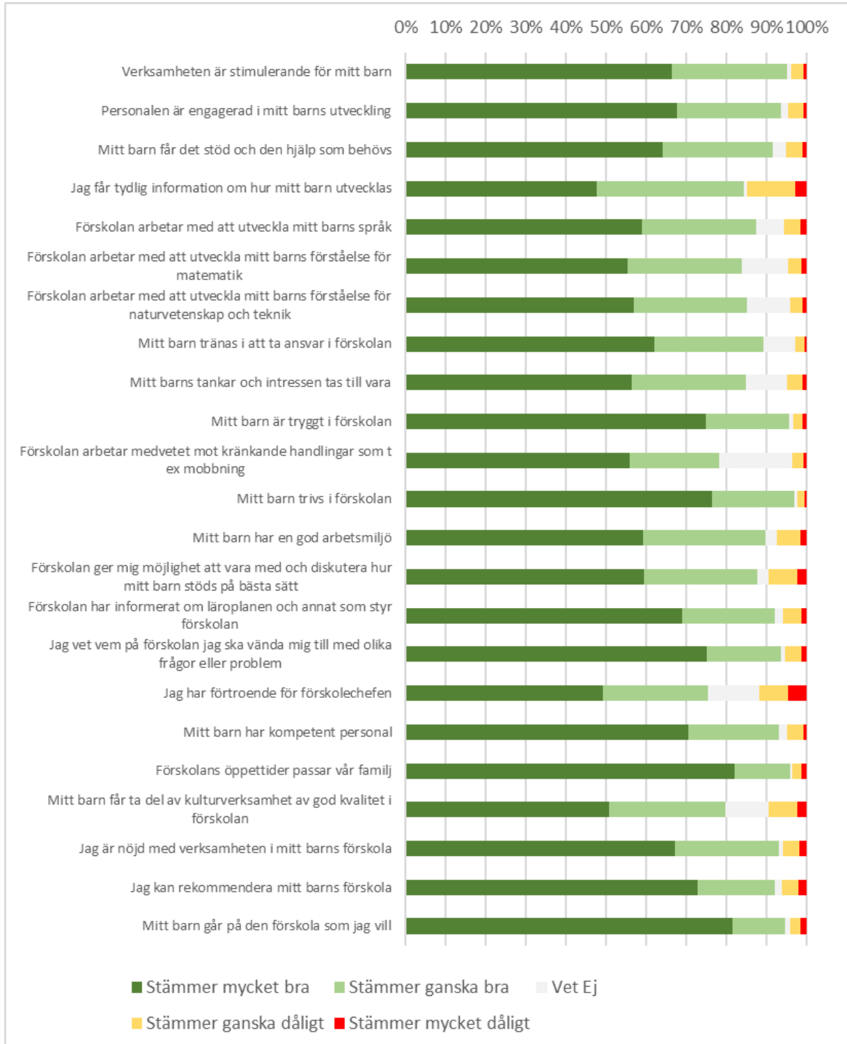
Figur 2: Föräldrars svar om förskola, 2018