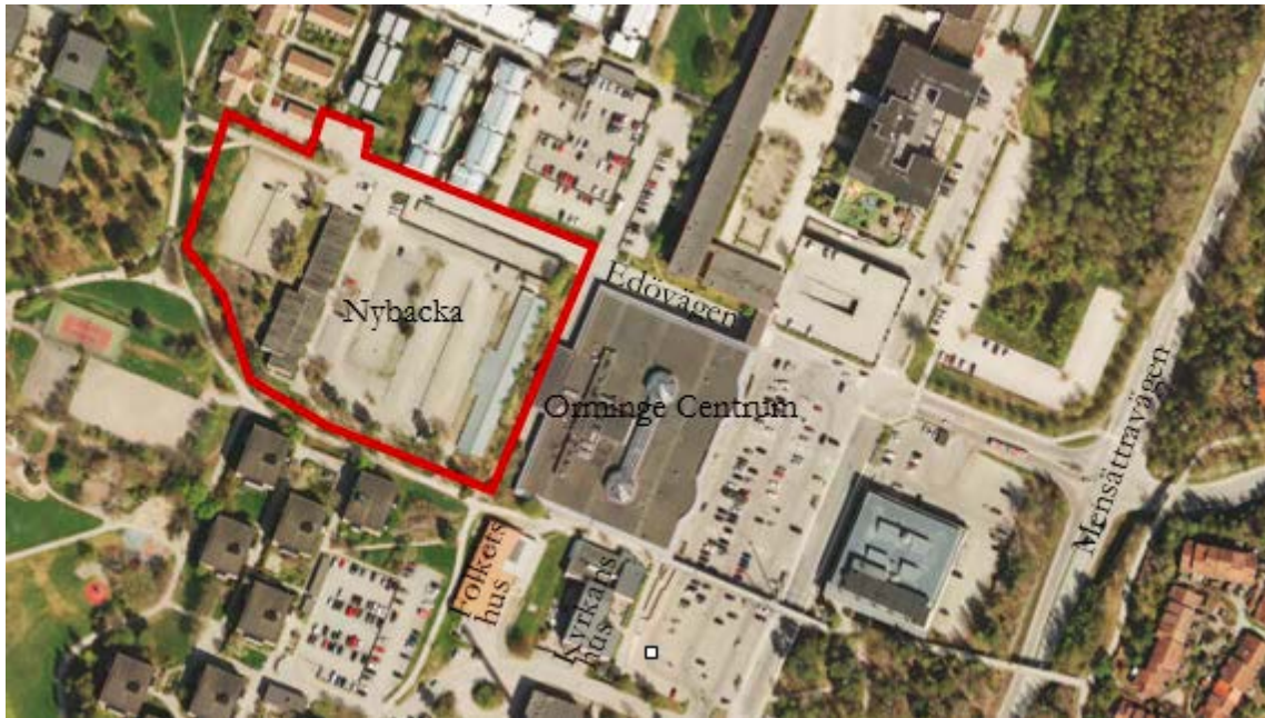
Flygbild över del av centrala Orminge med planområdets avgränsning inlagd.