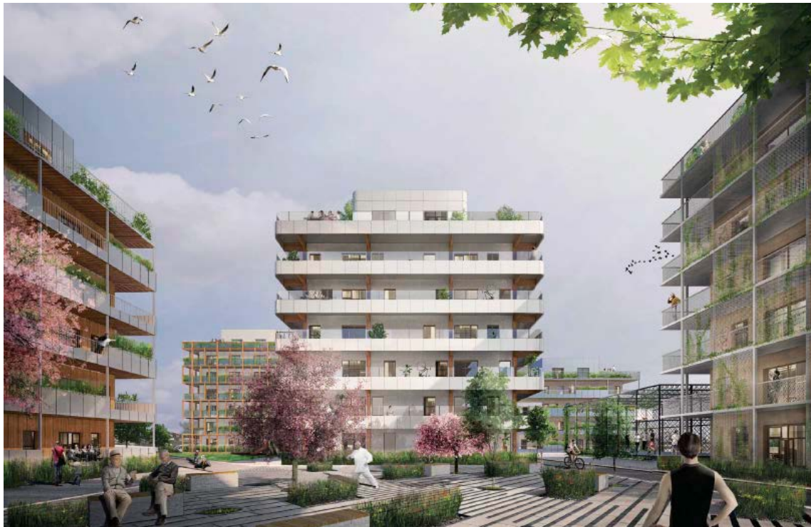
Vy från Nybackastigen väster ifrån. Dinell Johansson Arkitekter

Inom områdets östra del utgör temat aktiviteter för spontanidrott som löparbanor, bollbur, utegym, bouleanor samt gemensamma lek- och rekreationsytor. Den västra delen av kvarteret har tema för trädgård, odling, lek och rekreation. Inom de mer bostadsnära och skyddade delar av gårdarna anordnas sittplatser och lekytor för de yngre barnen. Naturmarken, i kvarterets västra del, avslutas i slutningen med sittvänliga gradänger med utsikt ner mot parken och idrottsplatsen.