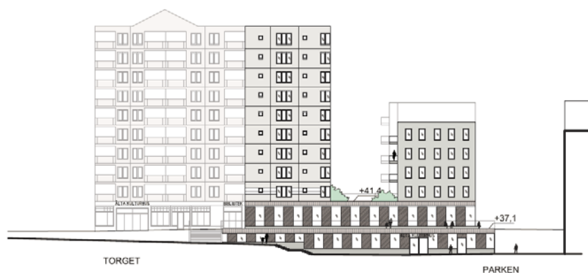
Figur 14. Kvarter 2, fasad mot öst. Befintligt höghus med föreslagen ny sockelbyggnad och bostadshus. Utformningen av husen är inte reglerade i planförslaget inför samråd.

Bottenvåningen medger centrumanvändning för kommersiella verksamheter och service. Bostadsentréer samt entréer till verksamheter placeras mot torg och gator, på så sätt aktiveras de offentliga rum som planeras i Älta centrum. Resterande delar av byggnaden planeras för bostäder. Kvarter 2 har en viktig funktion i Älta centrum på grund av dess användning som kulturellt centrum och mötesplats. Kvarteret har entréer mot torget för att levandegöra och skapa flöden på torget. Entréerna mot torget gör det även möjligt att använda detta i samband med kulturella evenemang etc. Kvarteret planeras inte underbyggas med parkeringsgarage. Parkeringsplatser för boende föreslås placeras i parkeringsgaraget under kvarter 3. Leveranser sker från kvartersgatan eller lokalgatan och angöring sker från kvartersgatan.