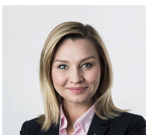
Ebba Busch Thor