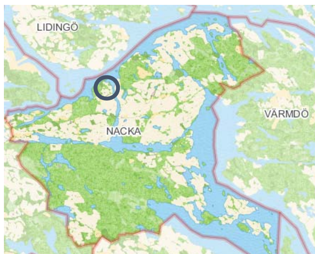
Norra Skuru inringat i kartan.

Kartorna nedan visar var i kommunen området Norra Skuru är beläget.