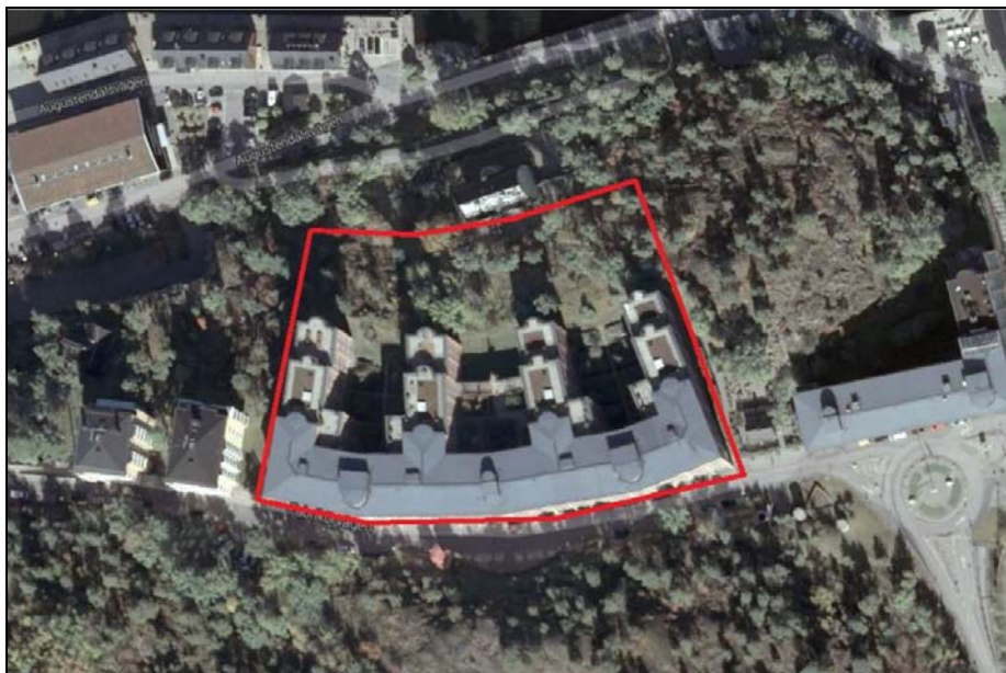
Tolkad detaljplanegräns (Översiktlig dagvattenutredning för hus 13, Sweco 2014-06-04)

Planområdet är till stor del bebyggt med det som idag är en stor kontorsbyggnad. I och med denna detaljplan tilläts bostäder där det tidigare inte funnits planstöd för detta. Planområdet ligger relativt långt från större vägar varför föroreningsbelastningen på hustaket främst har sitt ursprung i atmosfärisk deposition vilket utgör låga föroreningshalter. Enligt kommunens dagvattenstrategi kan rent dagvatten avledas direkt till recipienten. Då plangränsen går i husliv utanför hus 15 görs bedömningen enligt Sweco ( Översiktlig dagvattenutredning för hus 15, Sweco 2014-06-04 ) att dagvattnet kan ledas till Saltsjön via befintliga ledningsnät utan föregående rening. Planen genomförande innebär därmed endast marginella förändringar på dagvattensammansättningen.