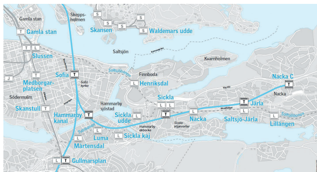
Tunnelbanans nya sträckning

I januari 2014 träffades ett avtal om utbyggnad av tunnelbanan mellan staten, Stockholms läns landsting samt kommunerna Nacka, Solna, Järfälla och Stockholm. Det innebär bland annat att tunnelbanans blåa linje förlängs från Kungsträdgården till Sofia, Hammarby sjöstad, Sickla, Järla och centrala Nacka. Avtalet innebär ett åtagande från Nacka kommun att bygga 13 500 bostäder på västra Sicklaön till år 2030. Tunnelbanan ska stå klar år 2025.