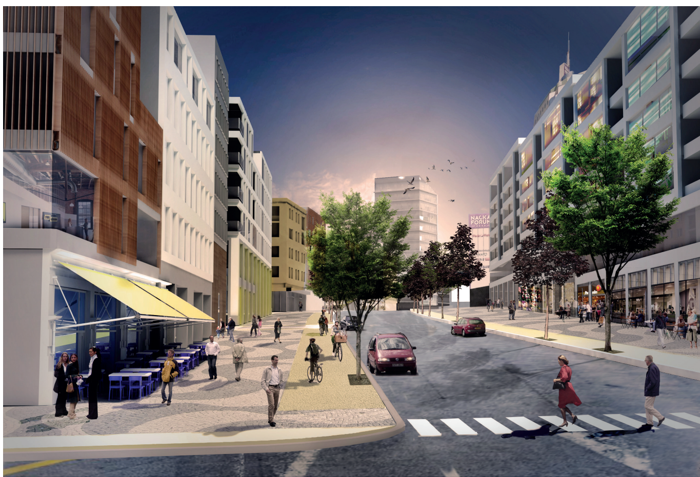
Centrala Nacka - tidig visionsbild. Källa: White arkitekter

Läs mer på nacka.se/stad eller dela på #NackaStad