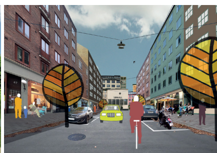
Bilder från Fundamenta, som beskriver och illustrerar stadsbyggnadsprinciper för Nacka stad.