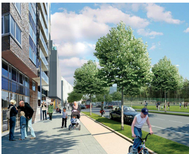
Tidig visionsbild för Griffelvägen. Källa: White arkitekter

Anbudsområdets belägenhet kommer att innebära sprängnings- och schaktningsarbeten vid byggnation. Det är Nacka kommuns avsikt att erbjuda kommande exploitörer att kunna köpa in sig i bergschaktsentreprenaden som kommunen upphandlar vid anläggning av allmänna anläggningar.