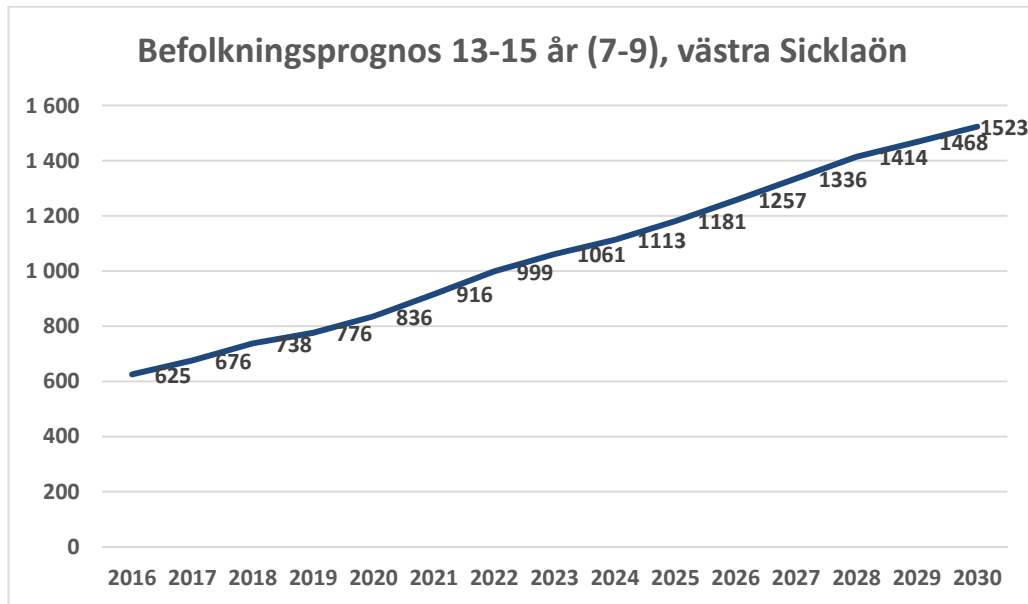
Diagram 2: befolkningsprognos 13-15 år, västra Sicklaön