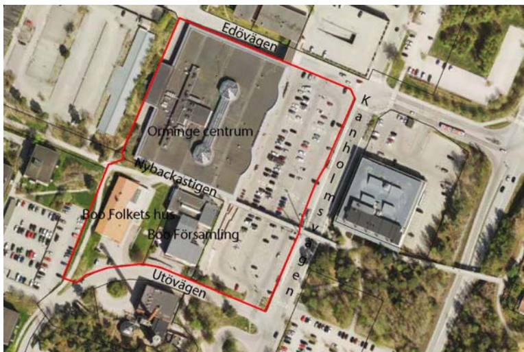
Ortofotot visar ett flygfoto över Orminge centrum och projektområdet markerat med röd linje.