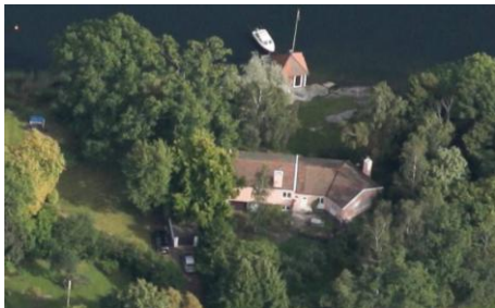
Solsidan 34:1 k