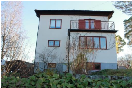
Solsidan 35:8 k, q