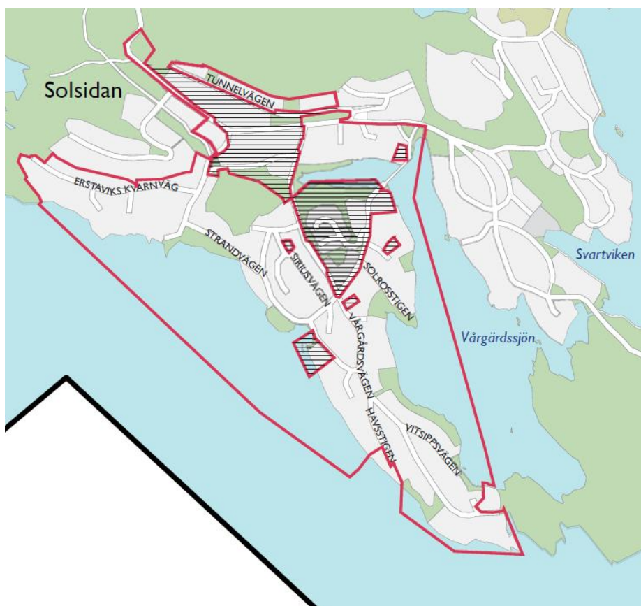
Ovanstående karta till visar områdets avgränsning.