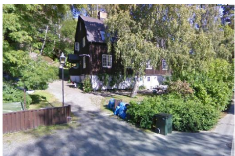
Solsidan 4:5 k, q