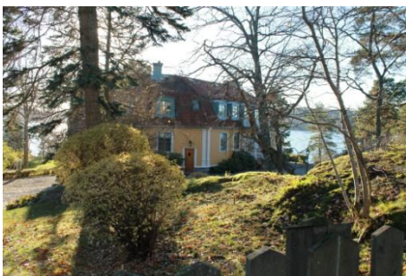
Solsidan 57:1 k, q