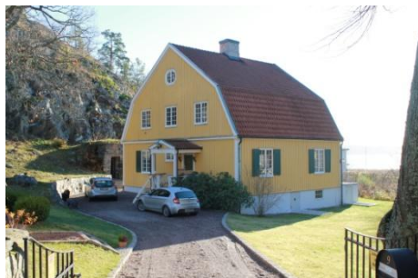
Solsidan 20:12 k, q