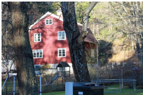
Solsidan 4:1 k, q