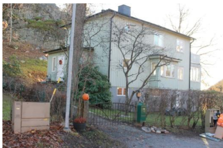
Solsidan 20:11 k, q