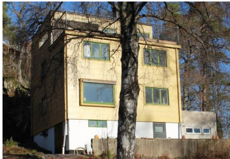
Solsidan 17:14 k, q