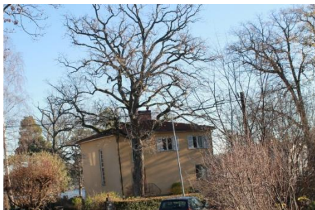
Solsidan 41:1 k, q