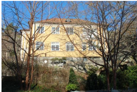
Solsidan 17:13 k, q