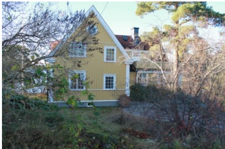
Solsidan 36:8 k, q