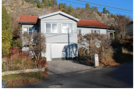
Solsidan 17:11 k