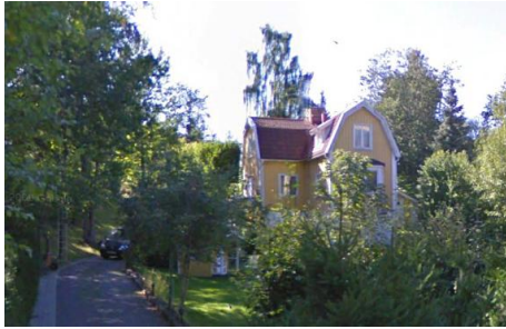
Solsidan 26:8 k