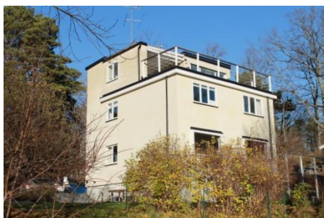
Solsidan 15:11 k, q