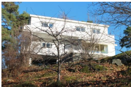
Solsidan 35:6 k, q