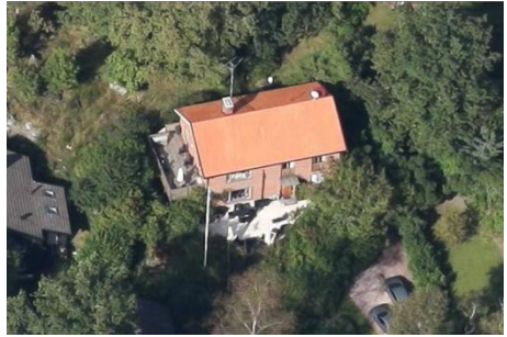
Solsidan 22:2 k