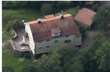
Solsidan 36:17 k, q