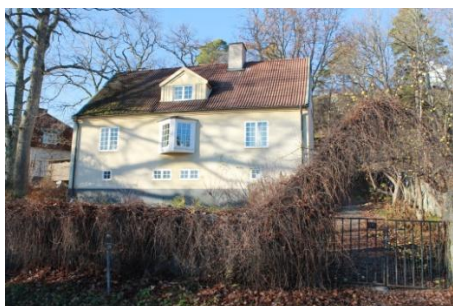
Solsidan 19:22 k, q