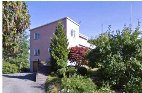
Solsidan 39:6 k