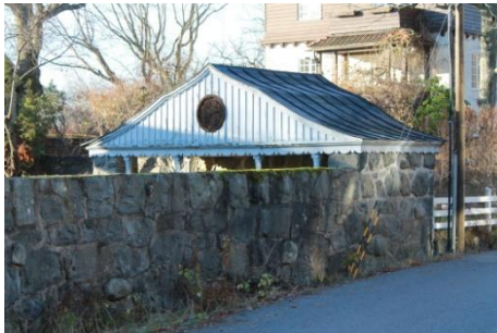
Solsidan 18:11 uthus k, q