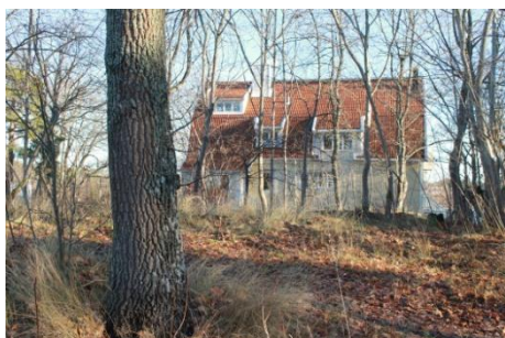
Solsidan 38:14 k, q