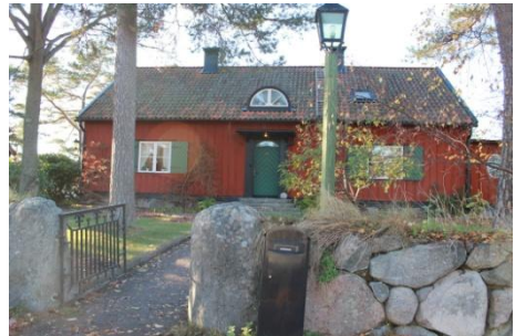
Solsidan 37:11 och härbre k, q