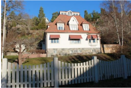
Solsidan 16:9 k, q