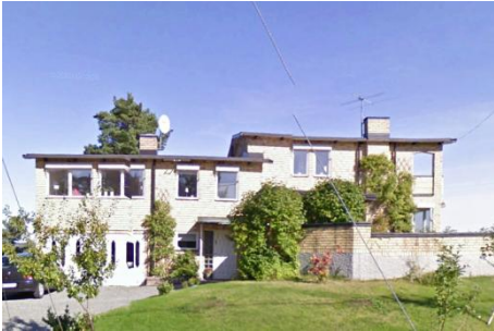
Solsidan 41:11 k