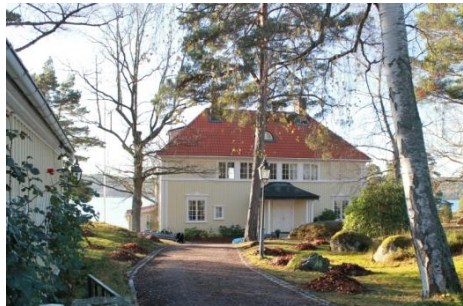
Solsidan 18:3 k, q