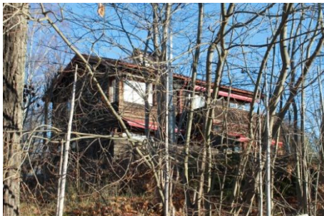
Solsidan 35:10 k