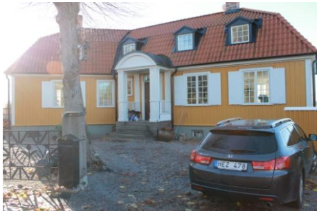
Solsidan 36:7 k, q