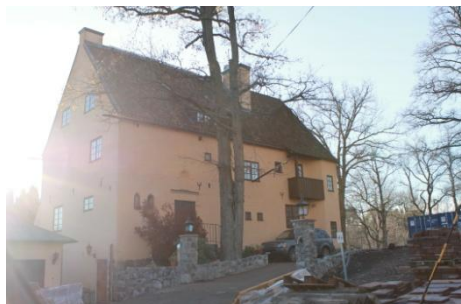
Solsidan 14:8 k, q