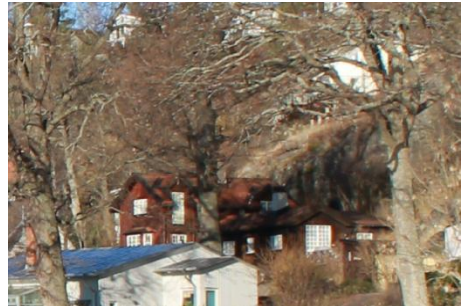
Solsidan 19:19 k, q