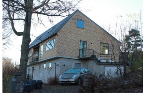
Solsidan 37:14 k