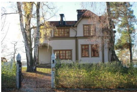
Solsidan 18:18 k, q