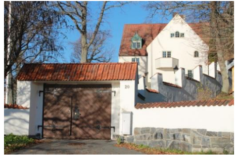
Solsidan 19:20 k, q