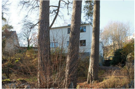
Solsidan 17:17 k, q