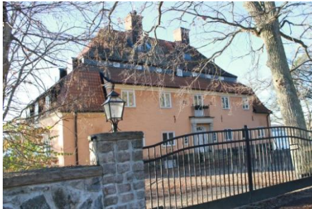
Solsidan 18:9 k, q