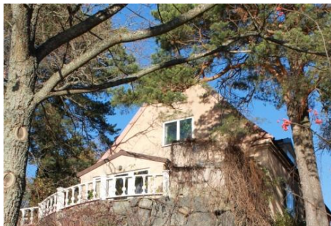
Solsidan 17:16 k, q