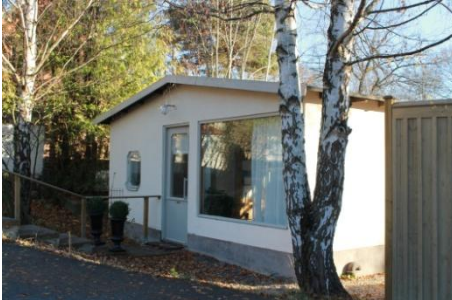
Solsidan 14:3 endast uthus k