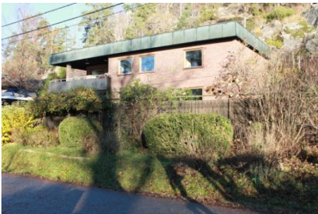
Solsidan 16:4 k