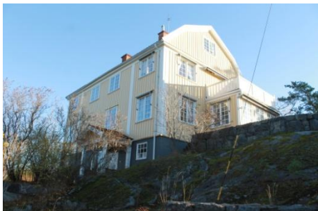
Solsidan 36:12 k, q