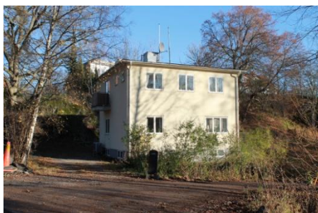
Solsidan 34:7 k, q