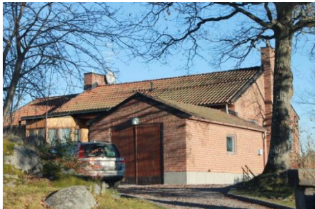
Solsidan 33:1 k