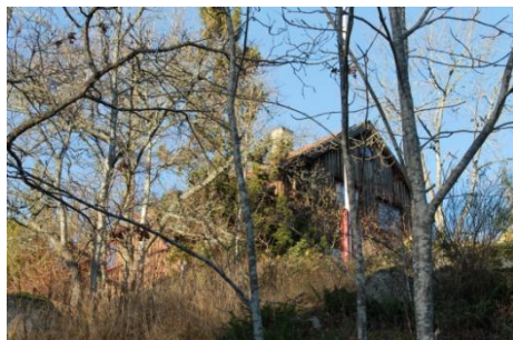
Solsidan 11:4 k, q