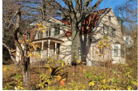
Solsidan 19:3 k, q