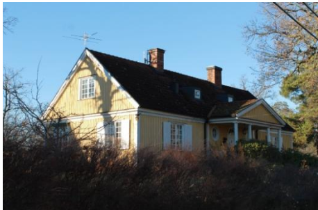
Solsidan 36:10 k, q