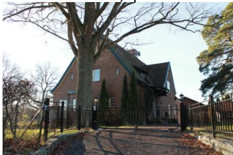
Solsidan 14:12 k, q