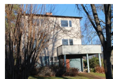
Solsidan 36:1 k, q