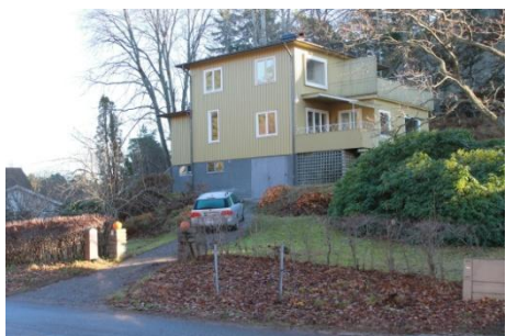
Solsidan 20:10 k, q