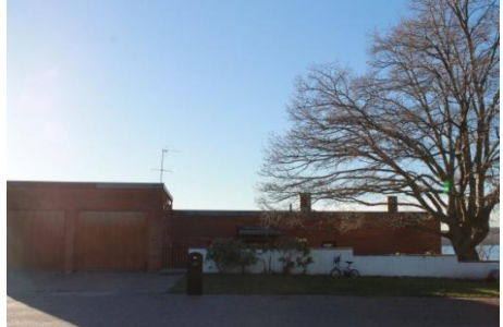
Solsidan 24:11 k