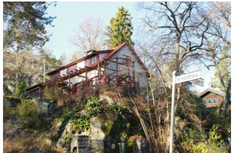
Solsidan 17:18 k, q