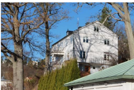
Solsidan 20:15 k, q