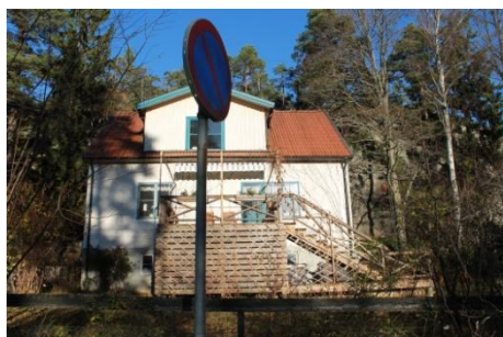
Solsidan 3:1 k