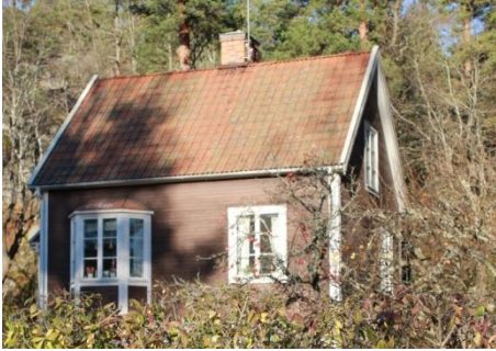
Solsidan 3:4 k