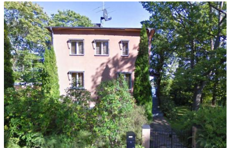
Solsidan 38:11 k