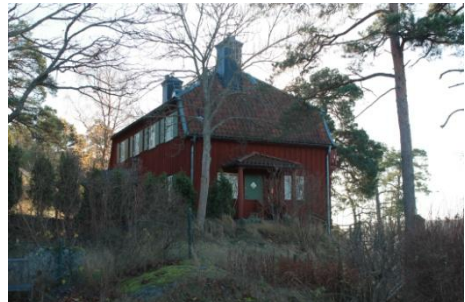
Solsidan 37:16 k, q