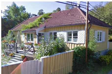
Solsidan 24:4 k, q