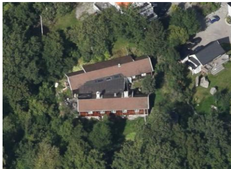
Solsidan 34:5 äldre del av hus k,q