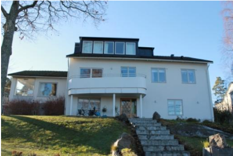
Solsidan 41:12 k