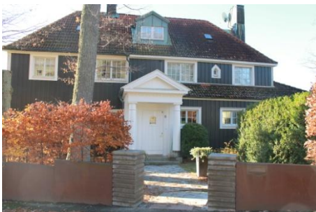
Solsidan 21:3 k, q