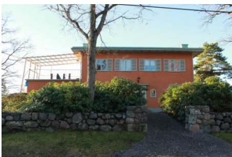
Solsidan 21:2 k, q