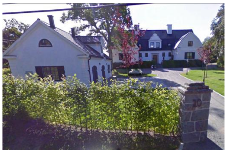
Solsidan 24:5 k, q