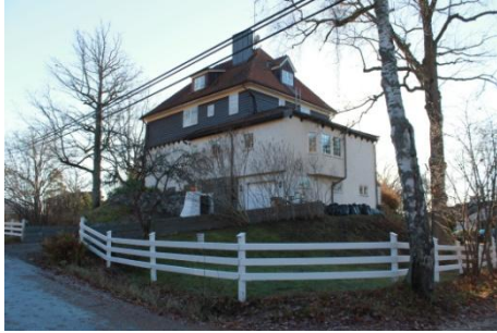
Solsidan 18:7 k, q