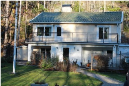
Solsidan 4:2 k