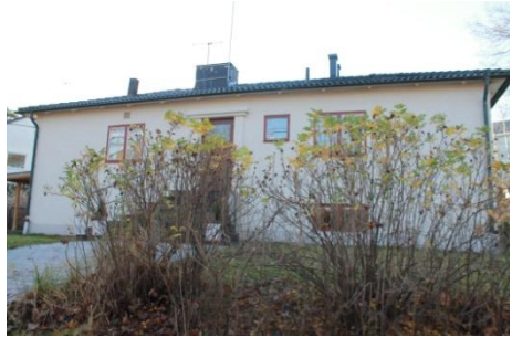
Solsidan 41:14 k