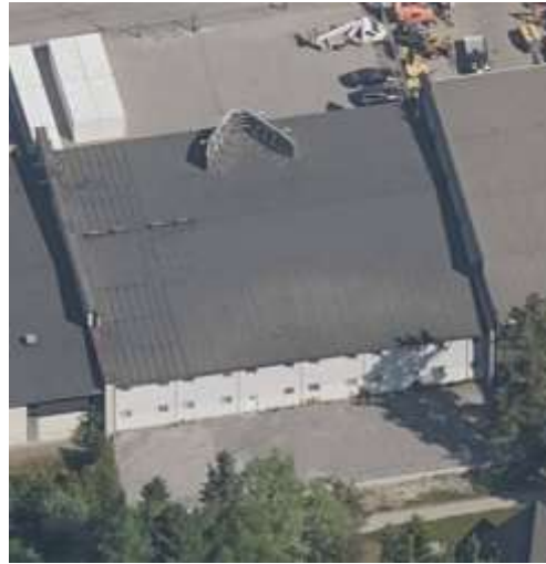
Flygfoto från den 23 maj 2018.

Bygglovenheten har i samband med handläggningen av ärendet konstaterat att åtgärden, uppställning av containrar, har påbörjats utan bygglov och utan startbesked. Bygglovenheten har i flera omgångar och senast den 29 december 2020 lämnat information om att byggsanktionsavgifter kommer tas ut och att det finns möjlighet att återställa det som är olovligt utfört senast den 21 januari 2021 för att byggsanktionsavgifter inte ska tas ut.