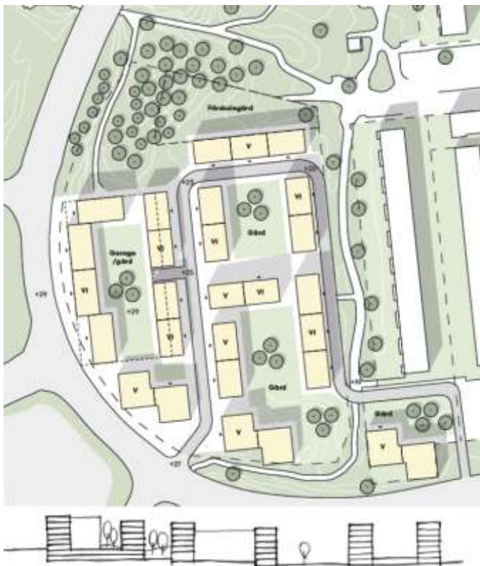
Förslag till situationsplan 1. 32 000 kvm BTA, från bilaga 3.

Sökande föreslår bostadsrätter till överkomliga priser för att få en ökad variation av bostadsbeståndet i Fisksätra, vilket kan ge möjlighet till boendekarriär inom stadsdelen. Sökande ger också förslag på att upplåtelseformer och hustyper kan variera.