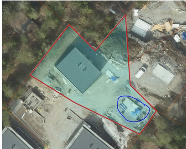
Flygfoto från 7 maj 2023 som visar att byggnation är påbörjad komplementbostadshuset är inringat i blått.

Detta innebär att det har skett en överträdelse av plan- och bygglagen. Eftersom rättelse inte har gjorts ska en byggsanktionsavgift tas ut.