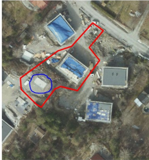
Flygfoto från 7 maj 2023 som visar att byggnation är påbörjad, grunden för komplementbostadshuset är inringad i blått.

Detta innebär att det har skett en överträdelse av plan- och bygglagen. Eftersom rättelse inte har gjorts ska en byggsanktionsavgift tas ut.