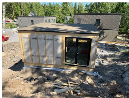
Foton från sökanden att byggnaden är under uppförande, inkom den 15 juni 2023.