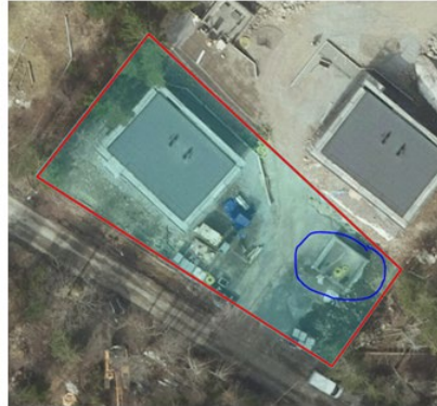
Flygfoto från 7 maj 2023 som visar att byggnation är påbörjad. Grunden för komplementbostadshuset är inringad i blått.

Detta innebär att det har skett en överträdelse av plan-och bygglagen. Eftersom rättelse inte har gjorts ska en byggsanktionsavgift tas ut.