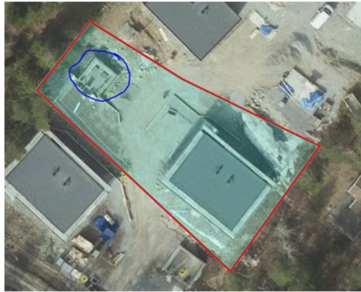
Flygfoto från 7 maj 2023 som visar att byggnation är påbörjad, grunden för komplementbostadshuset är inringad i blått.

Detta innebär att det har skett en överträdelse av plan- och bygglagen. Eftersom rättelse inte har gjorts ska en byggsanktionsavgift tas ut.