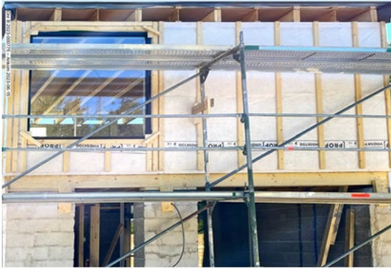
Foto från sökanden att byggnaden är under uppförande, inkom den 15 juni 2023

Detta innebär att det har skett en överträdelse av plan- och bygglagen. Eftersom rättelse inte har gjorts ska en byggsanktionsavgift tas ut.