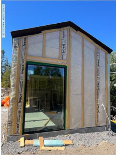
Foto från sökanden att byggnaden är under uppförande, inkom den 15 juni 2023.