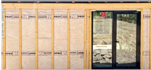
Foto från sökanden att byggnaden är under uppförande, inkom den 15 juni 2023