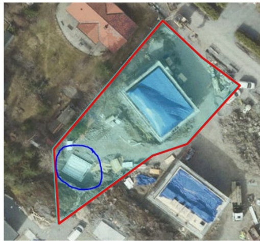
Flygfoto från 7 maj 2023 som visar att byggnation är påbörjad, grunden för komplementbostadshuset är inringad i blått.

Detta innebär att det har skett en överträdelse av plan- och bygglagen. Eftersom rättelse inte har gjorts ska en byggsanktionsavgift tas ut.