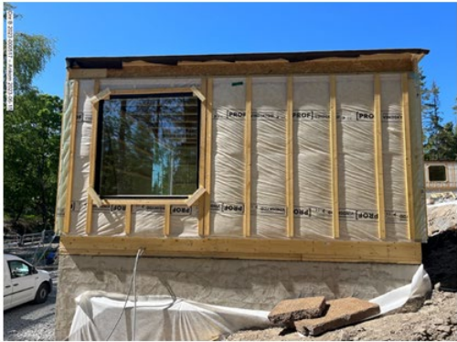
Foto från sökanden att byggnaden är under uppförande, inkom den 15 juni 2023.