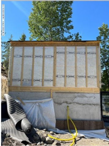
Foto från sökanden att byggnaden är under uppförande, inkom den 15 juni 2023.