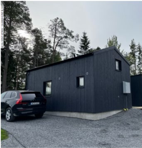
Foto från sökanden att byggnaden är uppförd inkom den 9 oktober 2023.