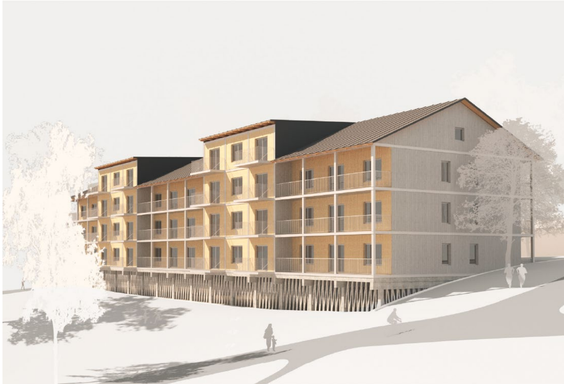
Bilden redovisar förslag på utformningen av bebyggelsen inom Sicklaön 73:49 och 73:50. Bostadsbebyggelsen har ritats av DinellJohansson arkitekter.

Vidare för den tillkommande byggrätten, på det befintliga flerbostadshuset, har en varsamhetsbestämmelse tagits fram som innebär att tillbyggnad eller påbyggnad ska utföras varsamt gentemot de värden och karaktärsdrag som 1940-talsbyggnaden bevarar.