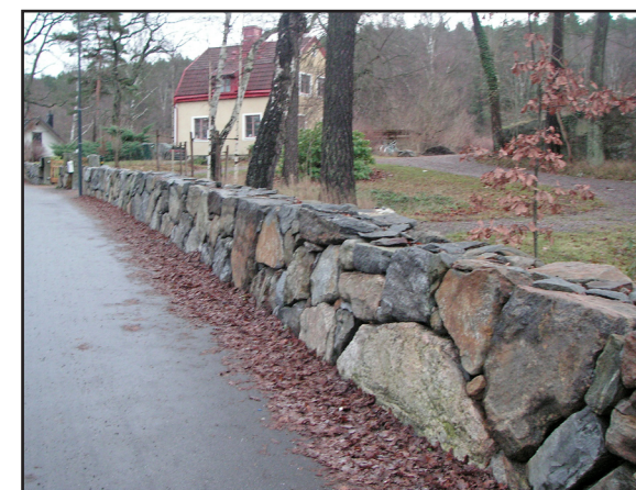
En låg mur utmed vägen.

att plank och murar runt skyddade uteplatser inte kräver bygglov om de placeras inom 3,6 meter från bostadshuset, inte är högre än 1,8 meter och inte placeras närmare gränsen än 4,5 meter. Om grannar som berörs medger en placering närmare tomtgräns än 4,5 meter krävs inte heller bygglov. För att undvika problem i framtiden rekommenderar nämnden att ta ett sådant godkännande skriftligt.