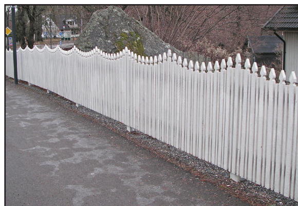
Oregelbundna former är svåra att bedöma. Är du tveksam – kontakta bygglovenheten.