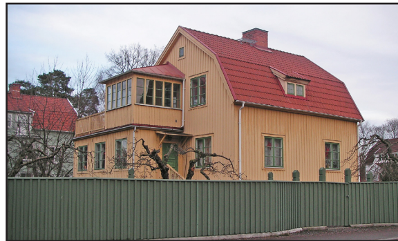
Ett plank ut mot trafikerad väg. Planket har på ett fint sätt tagit upp samma färg som finns i husets fönsterdetaljer