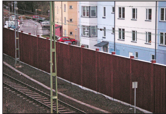
I bullerutsatta lägen kan plank ge tystare miljöer.

Tänk på att plank i bullriga miljöer utformas så att reflektionseffekter inte skapas. För att fungera som ett bullerskydd måste också speciella krav på konstruktionen uppfyllas.