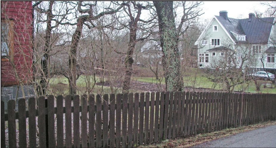
Det böljande, öppna landskapet i Storängen.