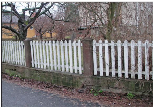
Ett klassiskt staket på ett kantstöd.

Syftet med riktlinjerna är att definiera när ett plank/staket respektive mur är bygglovpliktig och när det kan vara lämpligt eller olämpligt att uppföra ett plank med hänsyn till stads- och landskapsbilden respektive enskilda önskemål och behov.