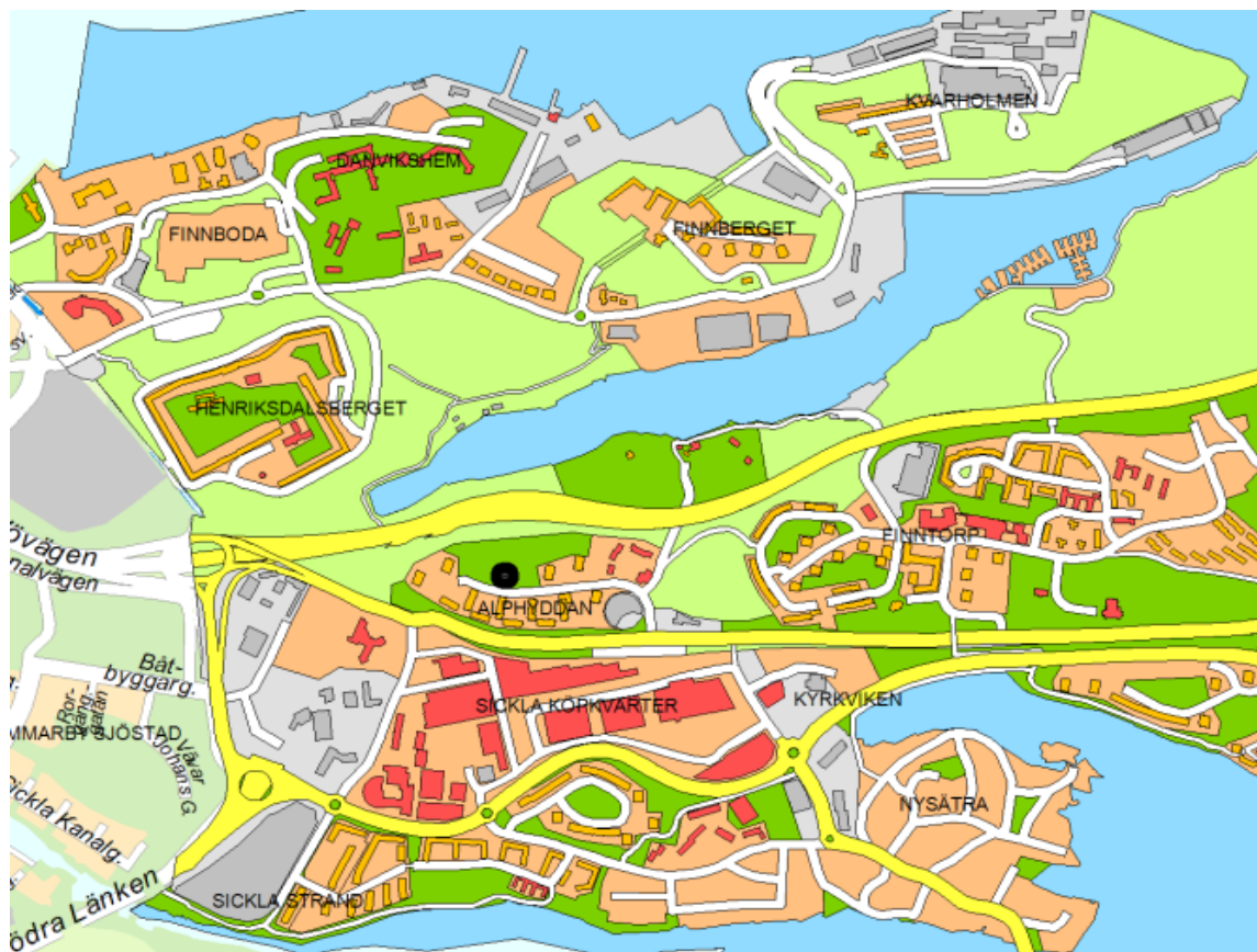
Planområdet är beläget längs Alphyddavägens norra sida i bostadsområdet Alphyddan