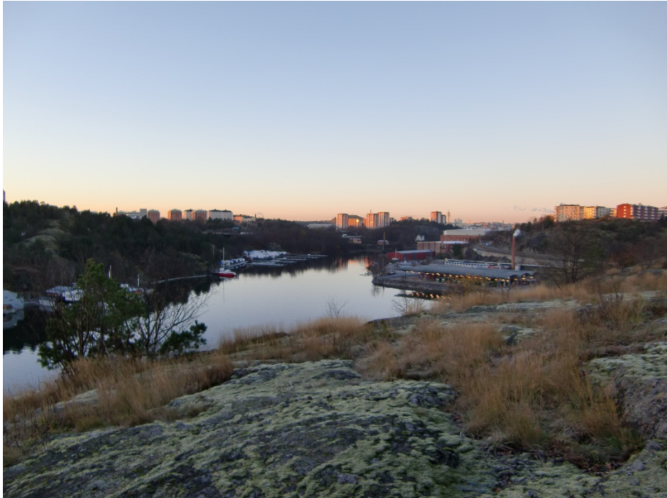
Figur 2. Utsikt från Platån österut. Bilden ger en uppfattning om områdets branta karaktär och tunna jordmån.

I dagsläget finns ett bostadsområde från 1930-talet inom DP5 omnämnt funkisområdet vilket består av två trävillor, en gammal konsumbutik samt flerbostadshus och radhus. Flerbostadshuset är lamellhus/smalhus med tre våningar och radhusen består av 30 lägenheter i fyra parallella rader. Till respektive radhus hör en mindre trädgård.