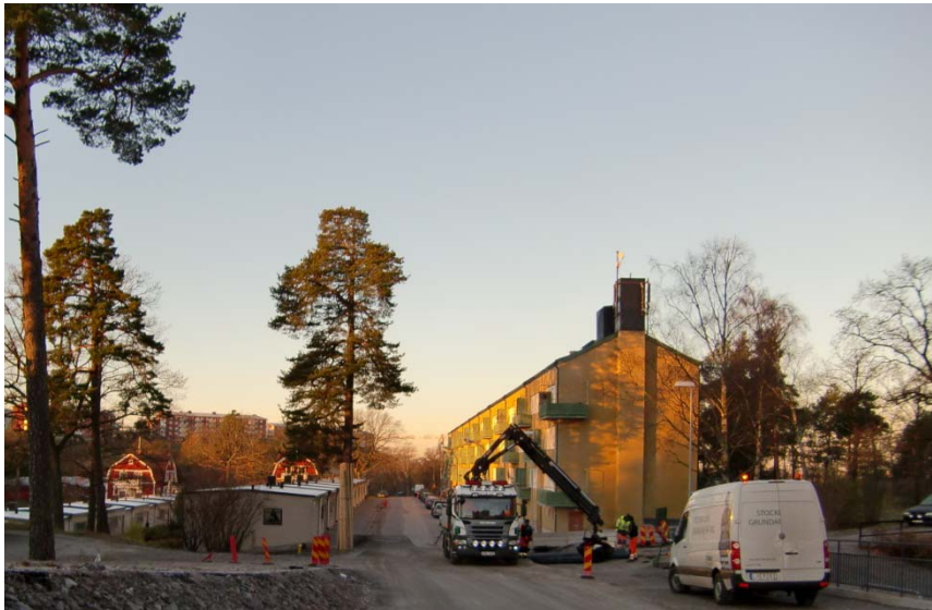
Figur 3. Del av Funkisområdet med det äldsta smalhuset till höger i bild och radhusen till vänster. I bakgrunden skymtar de två trävillorna.

Inom DP5 ingår delar av Kvarnholmsvägen, Mjölnarvägen och Brovägen som är de vägar som leder in till området. På platån på Kvarnholmens centrala delar finns i nuläget en grusad parkeringsyta som täcker en yta på cirka 0,2 ha.