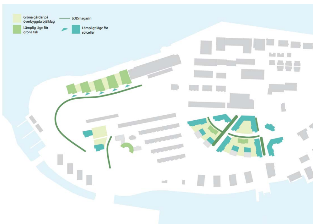
Figur 5. Gestaltungsprogram med förslag på placering av LODmagasin och gröna tak.

Inom avrinningsområde 4 finns förslag på LOD-stråk, se Figur 5, med infiltration i växtbäddar. Enligt gestaltungsprogrammet ska träd planteras på LOD-stråken och för att detta ska vara möjligt i gatumiljö bör dessa byggas upp som skelettjordar. Skelettjordarna kommer att fungera som fördröjningsmagasin samt minska halten näringsämnen och föroreningar som når recipienten. I gestaltungsprogrammet finns det även förslag på att några av husen skall ha gröna tak, vilket kommer innebära en flödesutjämning samt en rening av kadmium som delvis tillförs området genom atmosfäriskt nedfall.