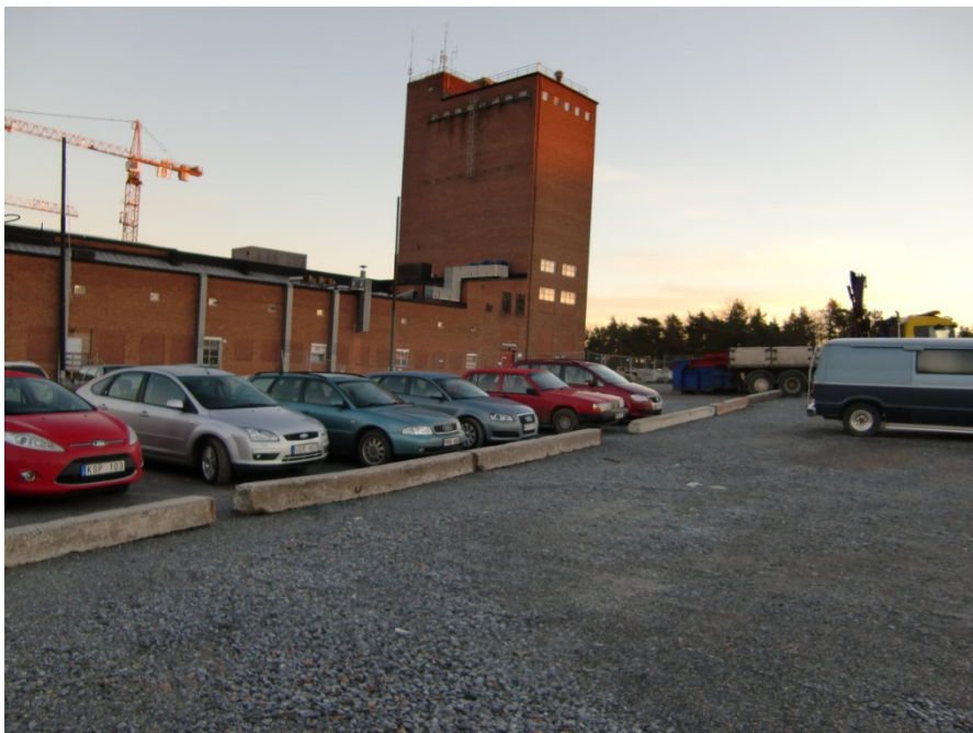
Figur 4. Del av Platån som idag används som grusad parkeringsyta, 2012-11-13.

Inom DP5 ingår delar av Kvarnholmsvägen, Mjölnarvägen och Brovägen som är de vägar som leder in till området. På platån på Kvarnholmens centrala delar finns i nuläget en grusad parkeringsyta som täcker en yta på cirka 0,2 ha.