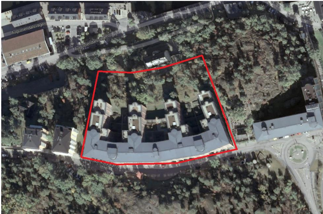
Figur 1 Flygbild med tolkade detaljplanegränser för hus 15.