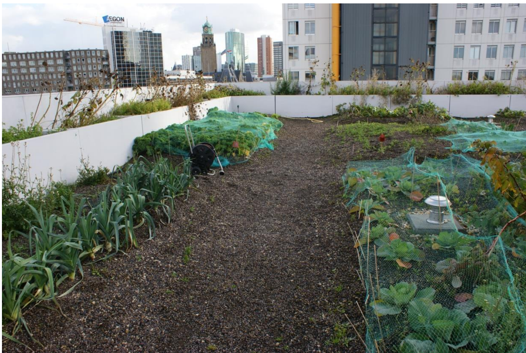
Figur 4. Exempel på grönt tak med odling.

I Figur 4 nedan visas exempel på ett grönt tak i ett bostadsområde där odlingar anlagts på taket av befintligt hus.