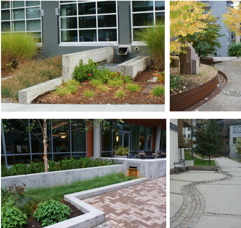
Figur 5. Exempel på utkastare och rännor kopplade till växtbädd.

Växtbädd på bjälklag bör utformas med dränerande lager och bräddbrunn för avledande av överskottsvatten vid kraftiga regn. Växtbäddarna har ett stort estetiskt värde och kan med fördel bli en del av den yttre gestaltande miljön.