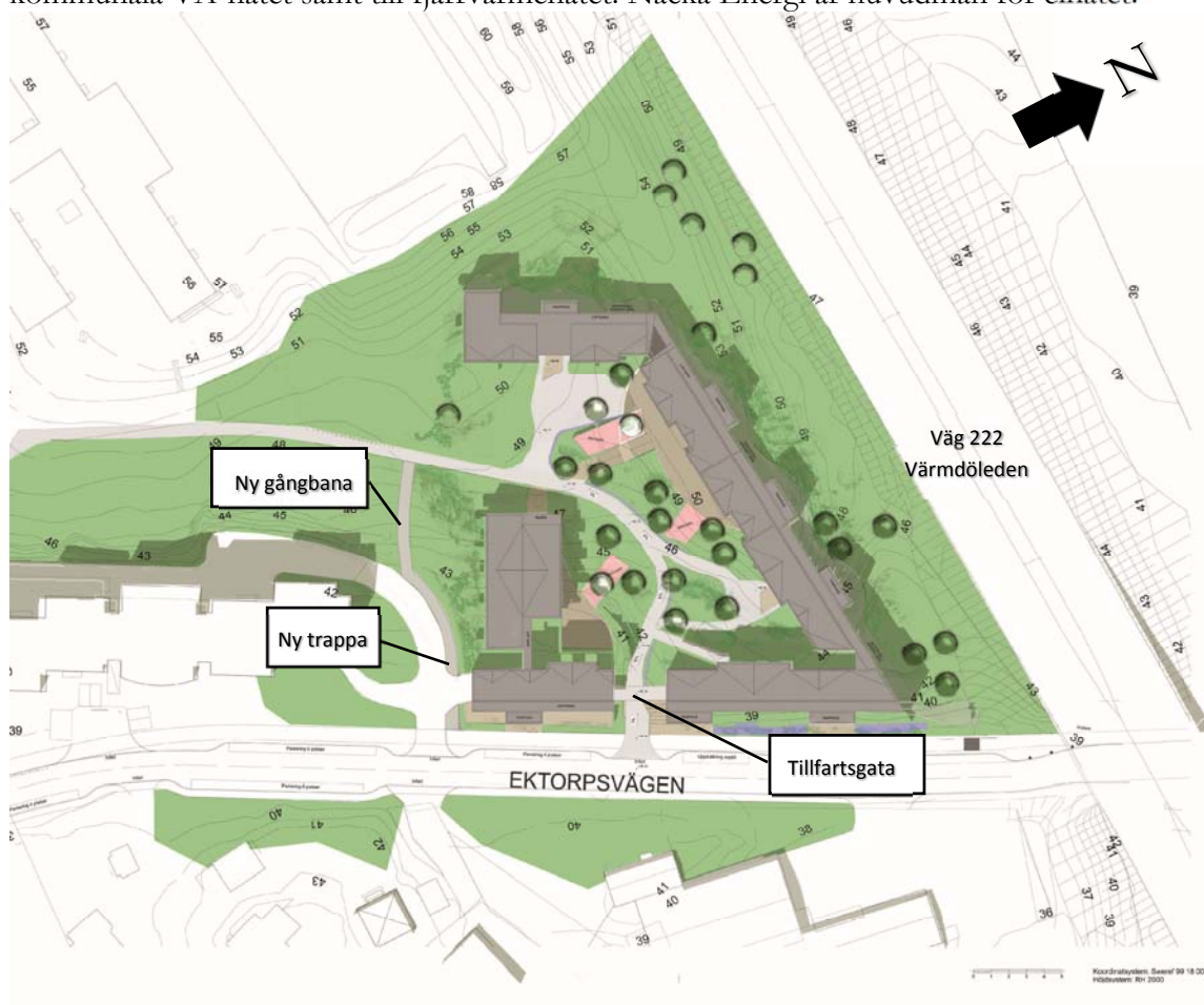
Illustrationsplan för studentbostäder i Ektorp.

Bland de allmänna anläggningar som ska utföras ingår bl. a. en ny gångbana bakom Nacka seniorcenter Ektorp inklusive en anslutande trappa från Ektorpsvägen. Befintlig gångstig genom området byggs om till tillfartsgata för boende. Ektorpsvägen planeras byggas om till stadsgata med kantstensparkering, trädplantering och ny gång- och cykelväg. Kommunen kommer i samma entreprenad även ombesörja att planområdet blir anslutet till det kommunala VA-nätet samt till fjärrvärmenätet. Nacka Energi är huvudman för elnätet.