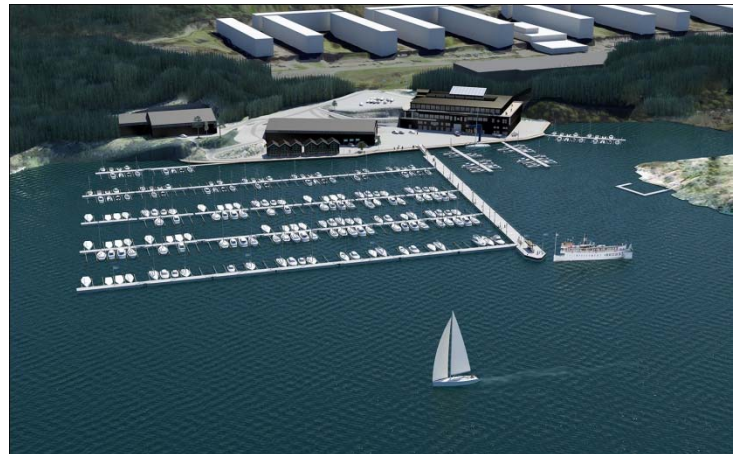
Vy från farleden och fågelperspektiv över Fisksätra marina.