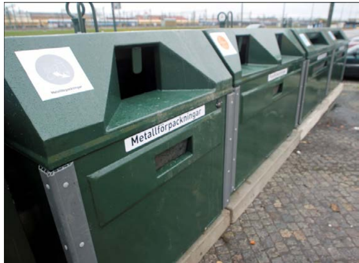
Exempel på krantömmande behållare.

Redan idag har nya behållare placerats ut på återvinningsstationen. Alla behållare är nu krantömmande och därmed i ett mer enhetligt utförande. Vissa behållare byts ut successivt beroende på gällande avtal. En ny typ av ljuddämpande glasbehållare finns framtagen och kan komma att placeras ut. Dessa behållare dämpar ljudet som uppstår när förpackningar lämnas i behållaren. Behållarnas placering i förhållande till planket har också en viss ljuddämpande verkan.