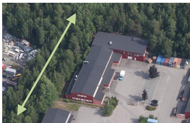
Grönt släpp till vänster, uppställningsyta till höger om byggnaden.