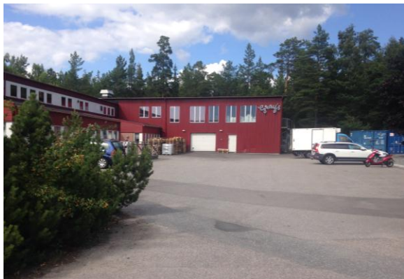
Gray's bakery från söder.

Planområdet består av befintlig industribyggnad samt en obebyggd yta öster om byggnaden. Den obebyggda ytan utgörs av platt hårdgjord mark som används som uppställningsyta samt ett mindre skogsparti med barr- och lövskog. Skogspartiet är en del av ett större naturområde som i sin helhet innehåller naturvärden klass 2 och 3 i form av bland annat barrskog och ädellövskog och har flera höga upplevelse- och rekreationsvärden.