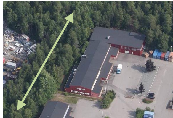
Grönt släpp till vänster, uppställningsyta till höger om byggnaden.