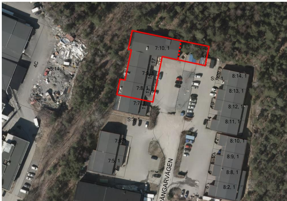
Plangräns. Befintlig verksamhet med föreslagen utvidgning markerad med streckad linje.

Planen möjliggör en utökning av existerande bageriverksamhet genom en utbyggnad av befintlig byggnad för produktions- och lagerytor. Föreslagen utbyggnad är cirka 240 kvadratmeter (20x12 meter). Tillbyggnaden kommer ha liknande utformning som befintlig byggnad, det vill säga stålkonstruktion med plåtbeklädnad och bedöms inte ha någon betydande inverkan på områdets karaktär. Användningen på detaljplanens kvartersmark är industri (I). Byggnadshöjden regleras till 5 meter. Verksamheten får inte vara störande för omgivningen och det ställs krav på stängsel för området på samma sätt som befintlig plan intill. Planförslaget innehåller också ett upphävande av strandskyddet inom ett begränsat område i nordöstra delen utanför tidigare planlagt område. Genomförandetiden är 5 år.