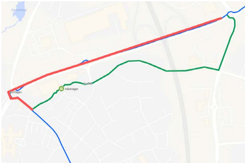
Figur 1 Dagens linjesträckning för linje 840 i blått, föreslagen ny sträckning i grönt samt borttagen sträckning i rött. Nytt föreslaget stopp vid Mårdvägen markerat i grönt.

Linjen får ändrad linjesträckning. Idag trafikerar linjen Gudbroleden (väg 260) men istället kommer linjen att trafikera Söderbyleden-Vendelsövägen-Dalarövägen. Linjen trafikerar hållplats Mårdvägen vid befintligt hållplatsläge på Vendelsövägen vid gångvägen till/från Port 73. Detta är en temporär omläggning i väntan på att en eventuell stomlinje för stråket är utredd. Linjen får även utökad trafik med två nya avgångar i morgonrusningen vardagar då pendeltägentågen till/från Nynäshamn har fått nya tidslägen.