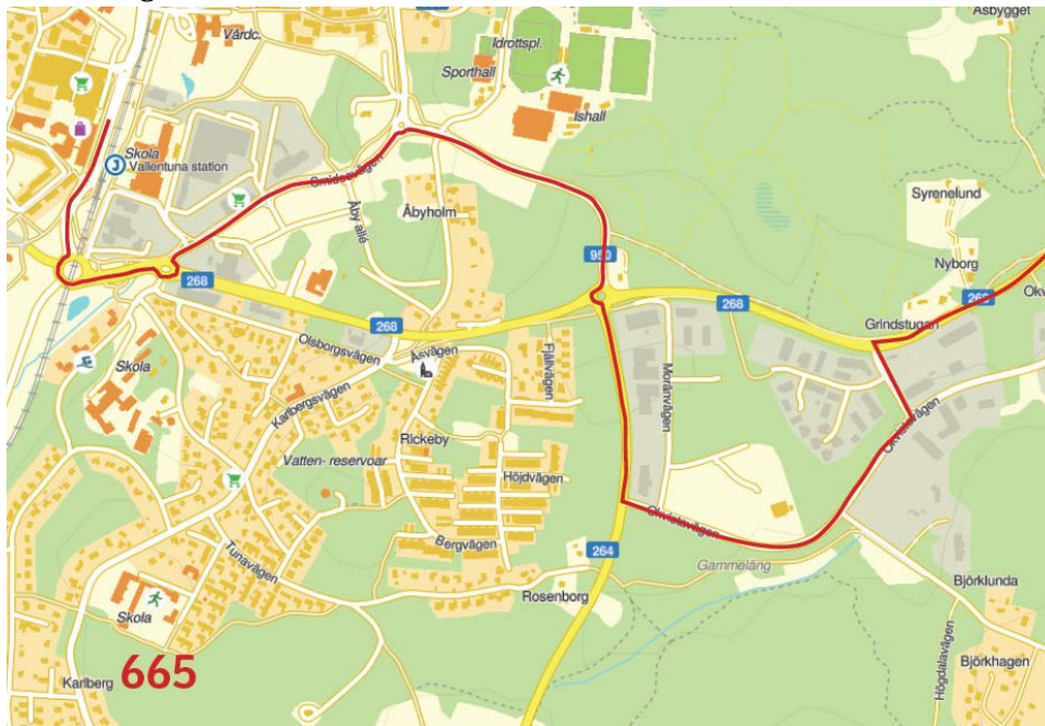
Figur 2 Ny linjesträckning för linje 665

Linjen får förändrad linjestäckning och gå via Vallentuna IP (Hagaskolan). Hållplats Bergvägen i riktning mot Kärsta försvinner. Ny hållplats Vallentuna IP. Linjesträckningen bli från Vallentuna ordinarie körväg till hållplats Hjälmsstavägen därefter vänster på Smidesvägen, höger in på Lindholmsvägen vid Rondellen Arningevägen ordinarie sträckning mot Kärsta.