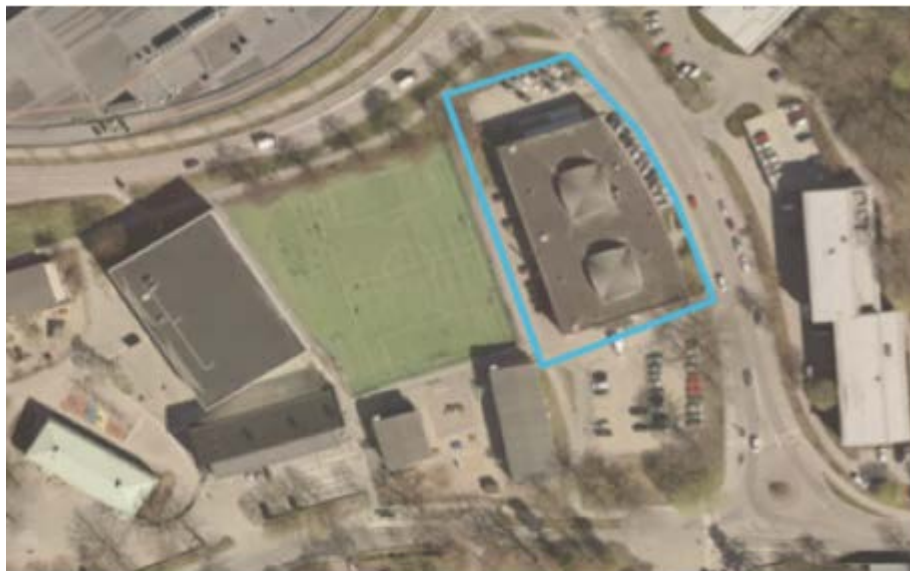
Bild 3, KKV-huset markerat med blå linje

I östra delen av projektområdet vid Planiarondellen finns f.d. Precisionsverktygs industribyggnad, idag kallad KKV-huset (Konstnärernas Kollektivverkstad). För att förbereda för nästa steg i projektet har hyresgästerna sagts upp för avflyttning och KKV-huset ska rivas.