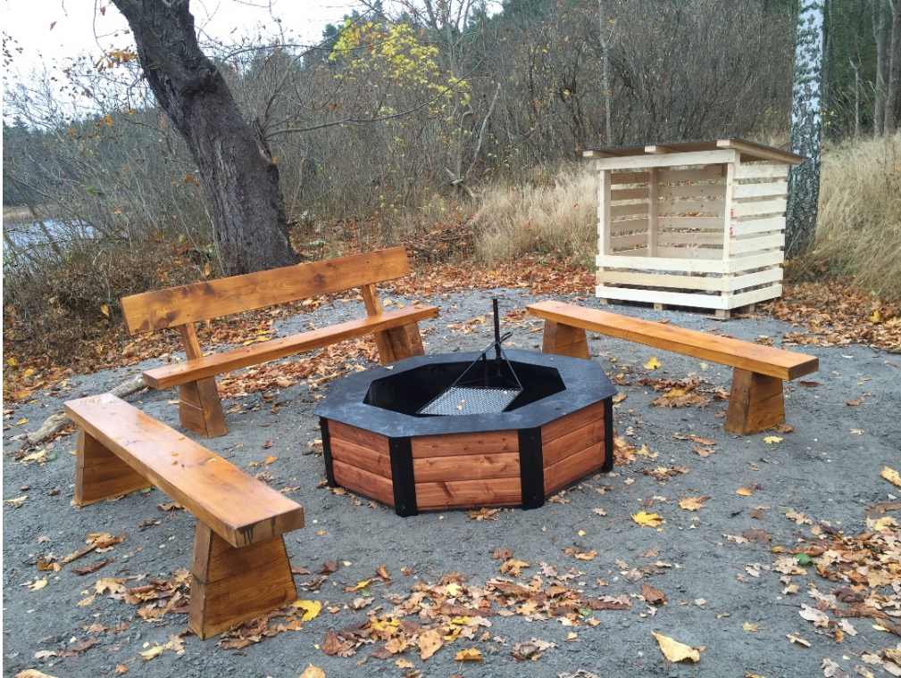
Grillplats på Skogsö. Exempel på utformning i naturområden.