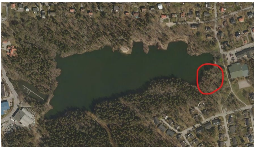
Markerat område är föreslagen placering av grillplats