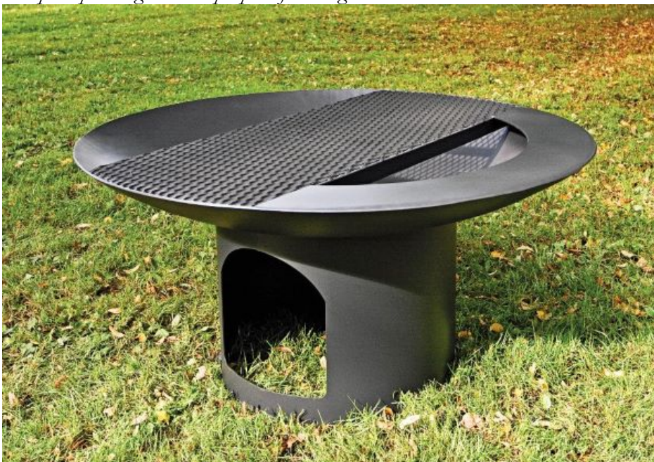
Exempel på grill som används i parker i Nacka.