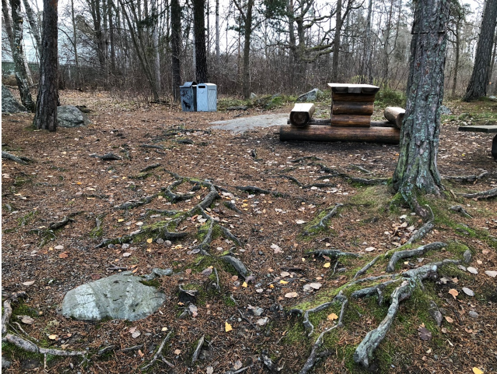
Befintlig picknick-område vid Långsjön. Behov av tillgänglighetsanpassning finns.