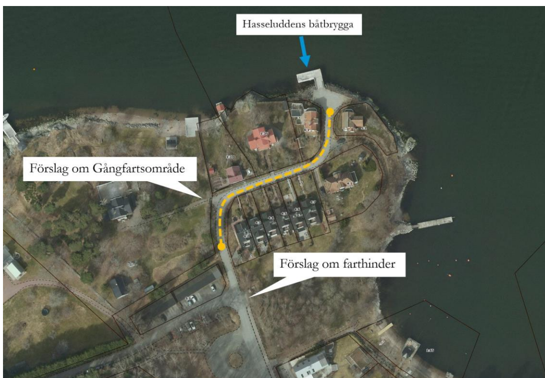
Figur 1. Översiktskarta med föreslagna åtgärder enligt medborgarförslag.

Syftet med medborgarförslaget är att omvandla den nämnda sträckan från Hasseluddsvägen 180 till och med Hasseluddens brygga till ett gångfartsområde. Utöver detta föreslås ett farthinder vid Hasseluddsvägen/Smiths väg, liksom en upphöjd korsning som finns vid Rensättra allé som ska verka för en hastighetsminskning. Figur (1) illustrerar var och hur dessa åtgärder planeras att genomföras.