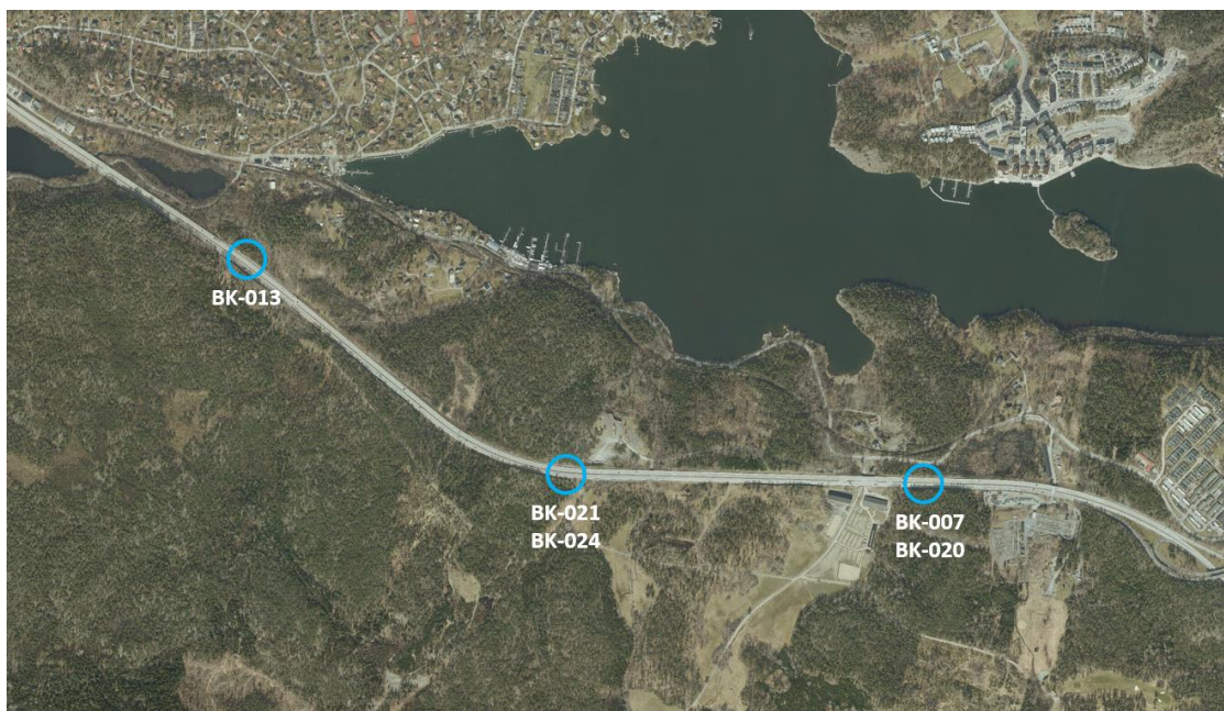
Figur 3: Flygfoto över bergskärningar på Saltsjöbadsleden. BK-007, BK-013 och BK-021 i norrgående riktning. BK-020 och BK-024 i södergående riktning. Ortofoto 2023.