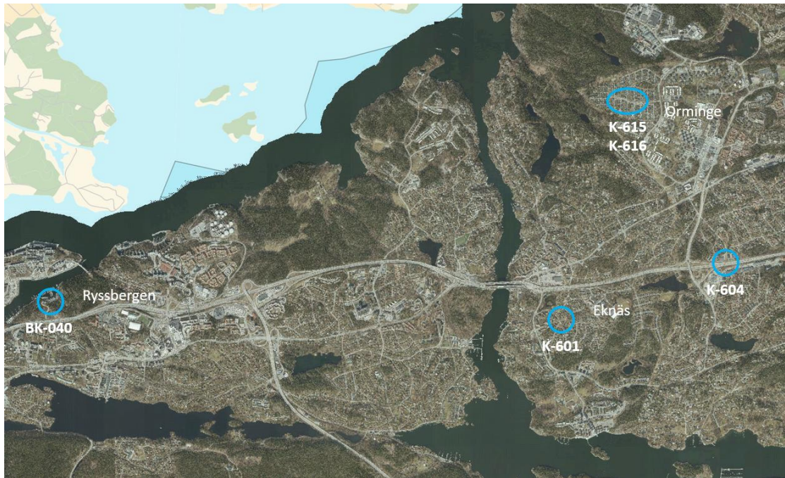
Figur 2: Flygfoto över broobjekt K-615 och K-616 på Hölövägen, K-601 på Eknäsvägen och K-604 i Telegramvägens förlängning. I väster visas bergskärning BK-040 på Marinstadsvägen. Ortofoto 2023.