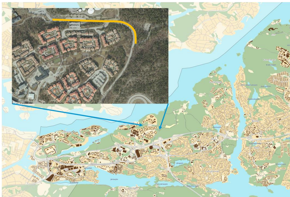
Figur 1. Översiktskarta över Skönviksvägen och sträcka som föreslagen gångbana ska anläggas.

Medborgarförslaget belyser den trafikfarliga situation som uppstår när gående, som rör sig från Ellenviksvägen till Nyckelvikens Naturreservat, måste dela utrymme med tung trafik längs Skönviksvägen. Samtidigt förväntas trafikvolymen öka längs Skönviksvägen till följd av öppnandet av på- och avfarten vid trafikplats Skvaltån. Eftersom avvecklingen av Bergs oljehamn och omvandling av Skönviksvägen dröja fram till år 2036, kommer tillgängligheten och trafiksäkerheten för gående till Nyckelvikens naturreservat fortsatt vara begränsad under en lång tid framöver.