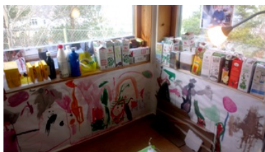
Hörn i de äldre barnens ateljé

I lokalerna för de äldre barnen finns olika hörnor som exempelvis matematik, språk, skapande samt smårum för fantasi, hemvrå och ett ”kojarum”. I femåringarnas lokaler finns en ateljé för färg och form. Ett varierat utbud av lekmaterial finns med något undantag tillgängligt på hyllor i barnens höjd. De yngre barnen kan inte själva nå ”skapandematerial” som exempelvis målarfärger.